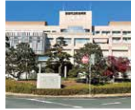
磐田市立総合病院