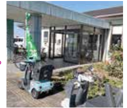
竜洋・ひまわりの郷