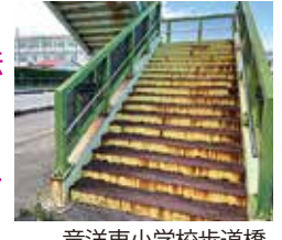
竜洋東小学校歩道橋